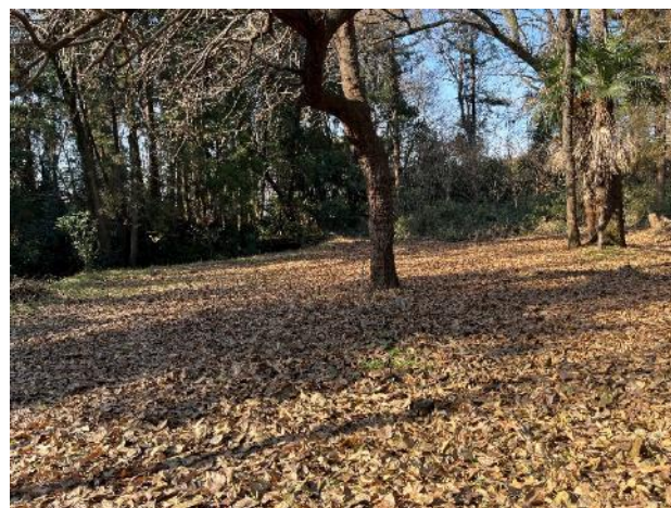
ベンチ撤去後の広場