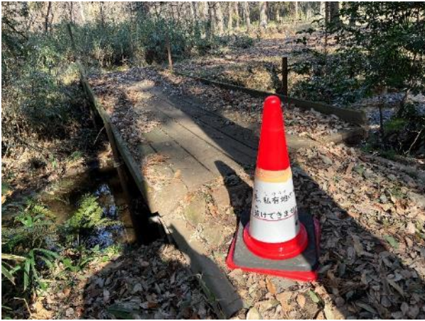
飯盛川の橋は渡れなくなっている。