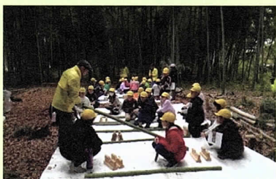
子供たちの竹細工