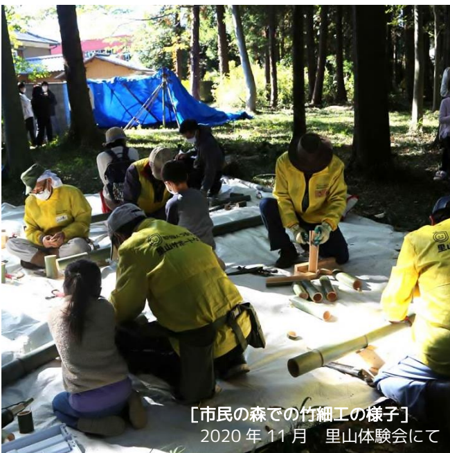
【市民の森での竹細工の様子】 2020年11月 里山体験会にて